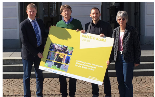
IKSK Stadt Krefeld - Energiebilanz 2017 Datenaufbereitung